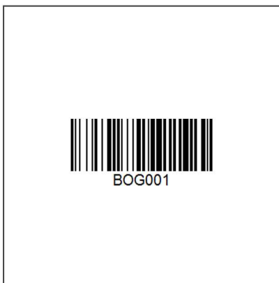
Lineare Codes mit Auftragsnummer