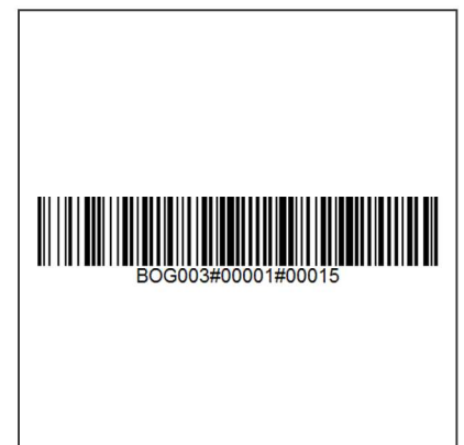
Lineare Codes mit Auftragsnummer, Seitenzahl und Anzahl Seiten pro Auftrag