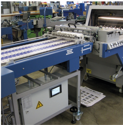
Schuppenband 550 im Anschluss an BSR 550 Servo mit neuer Ausbrecheinheit