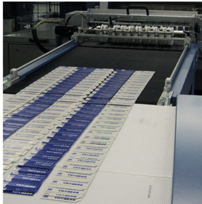
Direkte Übergabe der Produkte zum Spreizband