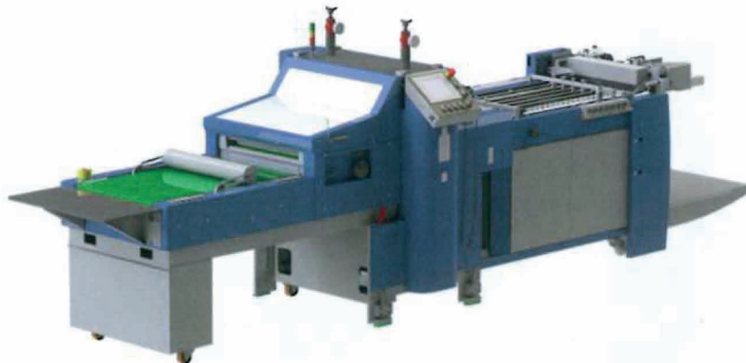
Die neue rotative Stanzmaschine BSR 550 basic von Bograma.

Die BSR 550 basic wurde, wie es der Name auch schon andeutet, auf die wichtigsten Grundlagen der bereits seit fünf Jahren am Markt etablierten Bograma BSR 550 Servo reduziert. Gestanzt wird auch in dieser Anlage mit zwei magnetischen Stanzzyklindern in der bewährten Technik, der Anleger und das Ausbrechsystem wurden jedoch teilweise neu konzipiert.